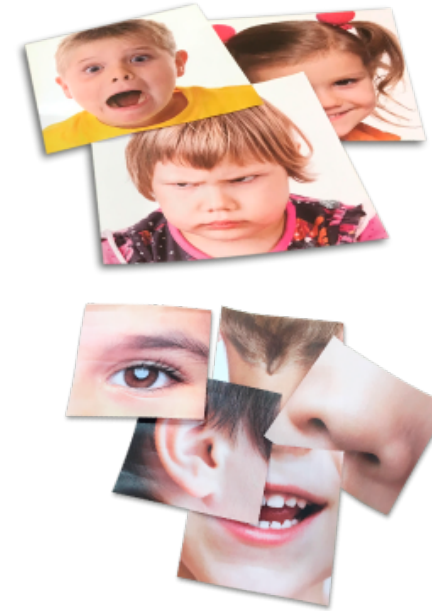
Gafas de las emociones